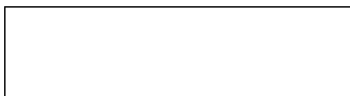
Схема границы балансовой принадлежности

(указать адрес, наименование объектов и оборудования, по которым определяется граница балансовой принадлежности исполнителя и заявителя)